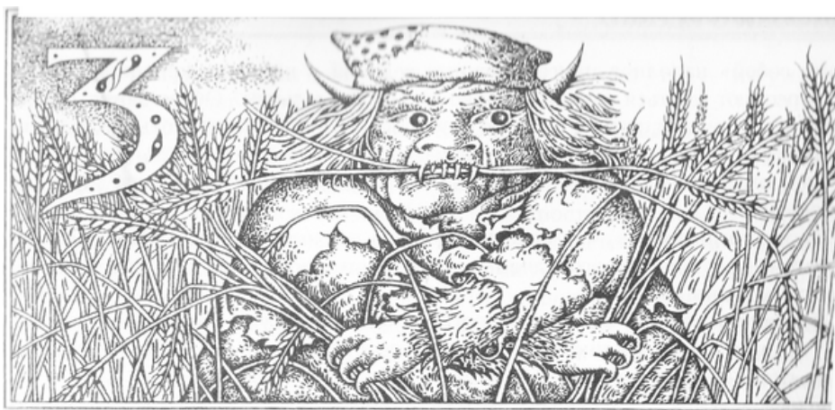
Изображение: Власова, М. «Энциклопедия русских суеверий»

Как уже было указано выше, «те, кто «знали»» или же «знающими» именовали тех членов прихода или жителей населенного пункта, кто, по мнению людей, занимался знахарством, гаданием, целительством и прочим. Практически повсеместно данное слово употребляется для характеристики рода деятельности конкретного человека. Факт дерганья риз священнослужителей встречается практически повсеместно.