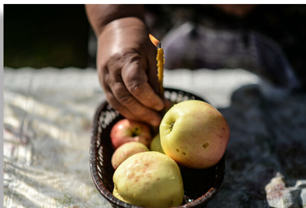
Изображение: «Яблочный спас: традиции верные и суверенные» - РИА Новости, 19.08.2017

«Считалось так, если до службы, от спаса до Преображения 19 августа мать, у которой умирали дети, а обычно дети умирают ну в большинстве семей, хоть один младенец да умирал, съела яблоко и грушу (яблоко было чуть больше, груш меньше) вот, то на том свете ребенку на тот самый праздник, на этот самый день, не то, шо когда-то, а именно на этот день Бог дает всем людям, всем умершим младенцам, детям, младенцам, отрокам не важно, по яблоку, по груше и к тому ребенку подходит, у которого мать до праздника съела хоть одно, но вроде