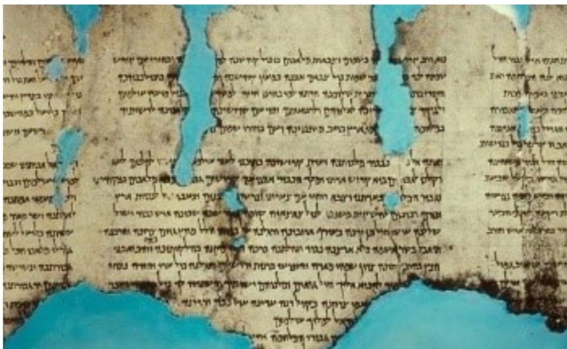
War Scroll.

interrelated approaches and to generate discussion across academic fields.