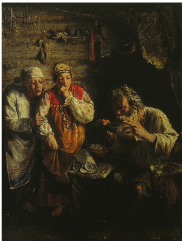
Мясоедов Григорий Григорьевич - «Деревенский Знахарь» (1860 г.)

«Вербой гнали скот и вербу ставили в кружок там, где куры были, чтобы волки не поели скот. Чертили освященным мелом круг» 1